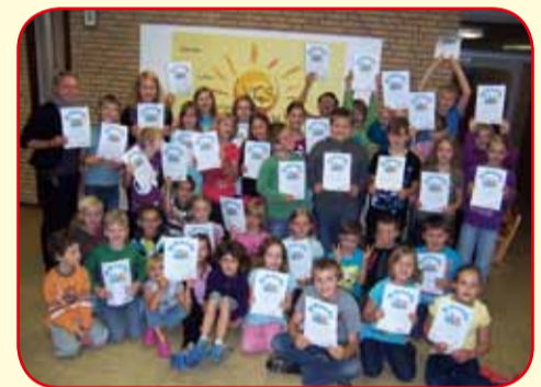
Burlager Kinder freuen sich über Urkunden für Schwimmleistungen

tung der Burlager erbaut wurde, sowie Sportanlagen und Spielplatz sorgen für bestmögliche sportliche Voraussetzungen. Eine Skaterbahn kann auch am Nachmittag von den Kindern genutzt werden.